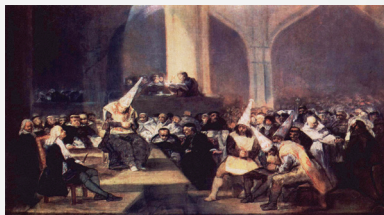
"Auto de fe de la Inquisición", de Francisco de Goya

La presencia judía en el territorio de lo que más tarde sería la Argentina se remonta a los tiempos de la América Colonial, cuando algunos de los "cristianos nuevos" provenientes de España y Portugal practicaban su judaísmo en forma secreta. Recién en 1813 se formalizó la Santa Inquisición y se aprobó el derecho para que cada habitante pueda ejercer su credo de forma privada.