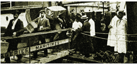
Desembarco de inmigrantes en el puerto de Buenos Aires.