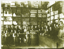
Almacén de la Cooperativa Granjeiros Unidos