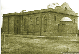
Sinagoga Barón Hirsch, 1928. Constructor Gregorio Seldman.

Ni bien pudieron los campos los colonos emplazaron sinagogas para rezar y mantener sus ritos y tradiciones. Hicieron alidá y mikve surgieron en las primeras colonias. Luego utilizaban el salón del Centro Juvenil Israelita y más tarde el del Centro Cultural. Un medio de una crisis que golpeó fuertemente a los colonos y retrasó por ello, la inauguración de la Gran Sinagoga para los Años Fiesta de 1920, las divisiones se hicieron notar en un principio, pues a esta altura los más antagónicos y los demás continuaban en el salón del Centro a lo que llamaban “Sinagoga budivística”.