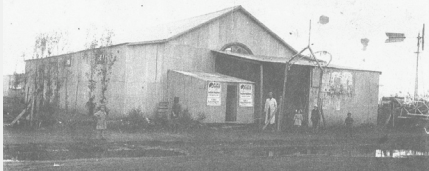
Galpón del Centro Cultural Israelita donde se desarrollaban distintas actividades culturales, como proyecciones de cine y realización de obras de teatro, 1927.

En 1914 la cooperativa Barón Hirsch creó un Centro Cultural que se denominó “Club de la Juventud Israelita para recreo y desarrollo intelectual” quien tenía posesión de los libros de la biblioteca desaparecida. Se levantó un salón de actos, especialmente para el teatro, actividad que se desarrollaba con un gran nivel de compromiso y concurrencia.