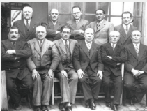
Comisión Directiva - años 30

Puso el énfasis en la cosecha diaria, esto es, la producción de la granja y de la huerta, que permitía al colonio independizarse del resultado de la cosecha de cereales para la subsistencia. Intercambiaba la estructura a la colonia logrando una importante fuente de ingresos para la misma y principalmente fomentaba a los colonos para la siembra, el almuerzo y la compra corriente de la misma cooperativa.